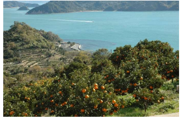
山の斜面に広がるみかん畑

さらに、島内の様々な団体が、島の魅力を体感できる様々なイベント「里島めぐり」を、一年を通して開催しています。