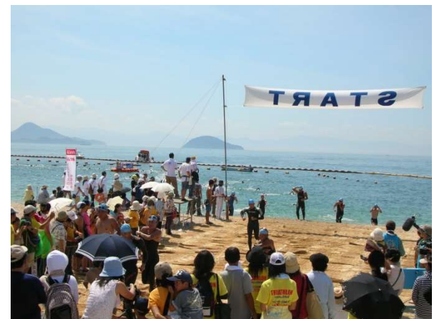
トライアスロン中島大会