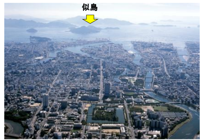
広島港から約20分の離島です。