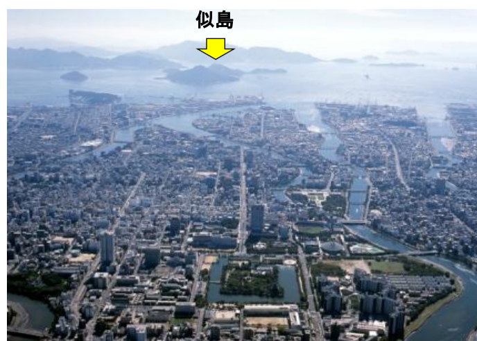
広島港から約20分の離島です。