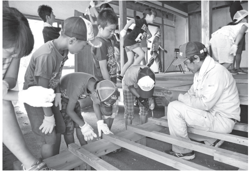
第1回ワークショップ「こわして! ぬって!」の様子。