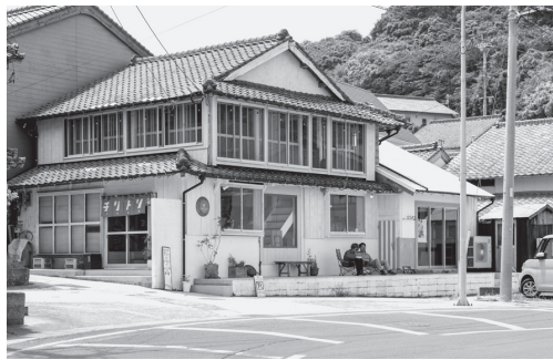
芦辺浦に整備した「たちまち」の拠点。

子どもたちの立ち寄り場ともなる拠点の物件探しには紆余曲折がありました。最初に目星をつけた物件は長年空き家だった場所。しかし、私たちと同時期に他のUターンの方が契約され、現在も生活されています。結果、選んだのは車通りがあるメインの道路に面した場所。拠点ができれば芦辺浦の景色に少し変化をもたらすことができるといことで、二〇一八年七月に、食堂併設の拠点をここにすることにしました。当初、拠点は食堂と別々の場所に設けようと考えていましたが、幅広い世代の人が交流する可能性を考えて食堂併設と決めました。