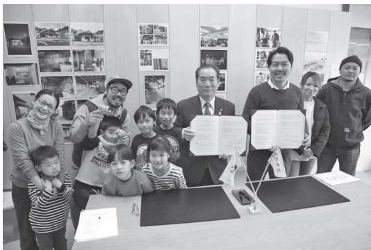
2019年2月に吉崎市と空き家問題対策で協定を締結(中央が白川博一市長)。

その場所を大事にしてきた人がいるのなら、 これからもそうしていきたい。そして大事にし