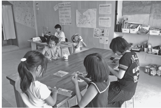
「たちまち」は子どもたちが立ち寄る場所にもなっている。

「住むところはどこかしらある、これだけ家があるんだから」と最初は思っていたのですが、活動を始めて「手をかけずそのまま住める家がない」ことに気づきました。そして「住まいを準備しよう。しなければ」と強く思うようになり、自然と動き始めました。