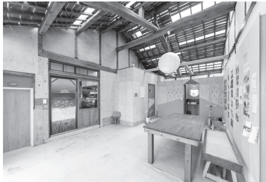
拠点「たちまち」の館内。