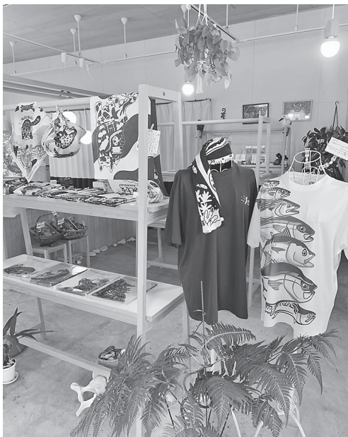
事務所に併設する「いきもの雑貨店」の店内。