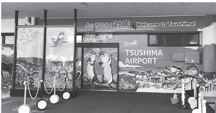
対馬空港の到着ロビーでは、島の生き物のイラストが出迎えてくれる。