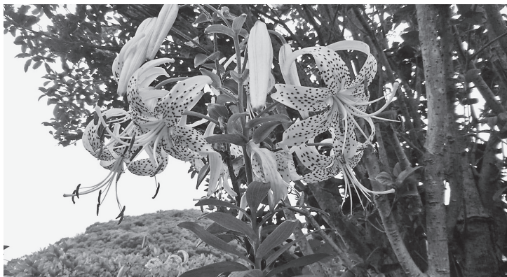
対馬の固有種「オウゴンオニユリ」。

二〇一三年に設立された組織です。当時、対馬市の域学連携事業（総務省所管・二〇一二年年度補正予算）が採択され、大学生の受け入れや地域関係者との連絡調整など、中間支援を担当する事業者が必要とされていました。そこで、協働