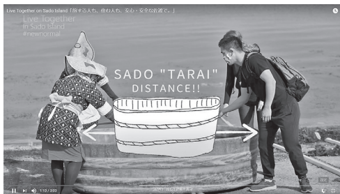
新しい生活様式を取り入れた佐渡旅行を映像で紹介する「Live Together on Sado Island」( https://youtu.be/HquvjYmuj0 )。

観光業支援に向けては、無料の会員登録サービス「佐渡アイランドサポーター」『さどまる倶楽部』のアプリ会員を対象に、島内で利用できる電子通貨「だつちゃコイン」によるポイントバックキャンペーンを実施しました。