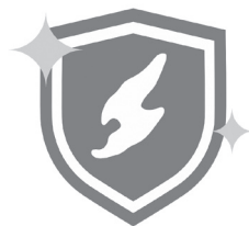
佐渡クリーン認証マーク。

また、これにあわせて、認証を受けた施設を利用する場合にその宿泊代金の二分の一（上限あり）を値引きする「佐渡クリーン認証」のお宿に泊まる——県民限定宿泊補助キャンペーン」を実施しました。六月一日より新潟県民を対象に五〇〇〇泊限定で実施した