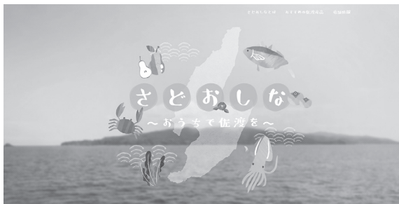
佐渡の特産品を集約したポータルサイト「さどおしな」 ( https://sadooshina.com/ )。

も多いなか、自宅でも佐渡産品を楽しんでいたいただけるよう、ポータルサイト「さどおしな」を四月二十七日に開設しました。これは、佐渡の商品を取り扱う事業者の電子商取引（EC）サイトを集約したもので、購入希望者は、店舗情報や商品のカテゴリを見て、リンクされた