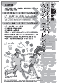
ヘルシーチャレンジのポスター。

健康教室や各種スポーツ大会などの開催が相次いで見送られる状況ですが、ゲーム感覚で楽しみながら中高年層のメタボ解消や若い世代の健康意識の向上につなげていきたいと考えています。