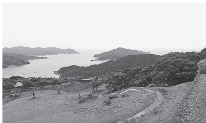
峰田山公園から焼内湾を望む。

け付けています。この支援を受けた事業者の方からは、「直接的な収入になるのでありがたい」との声をいただいています。