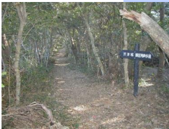
(トレッキングコース)