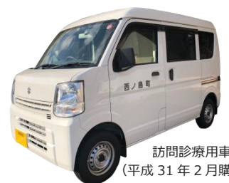
訪問診療用車両 (平成31年2月購入)

歯科診療所の運営による収入（診療報酬、健診受託料等）はすべて指定管理者の収入となります。その収入から、従業員の給与、光熱水費、消耗品等の経費を差し引いたものが、実際のご自身の収入となります。