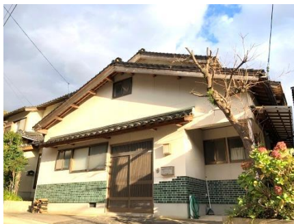
木造2階建 (平成2年11月完成)

診療所から徒歩3分(約220m)のところに、歯科医師住宅があります。住宅からの徒歩圏内には、商店や飲食店、銀行や郵便局などの金融機関もあります。