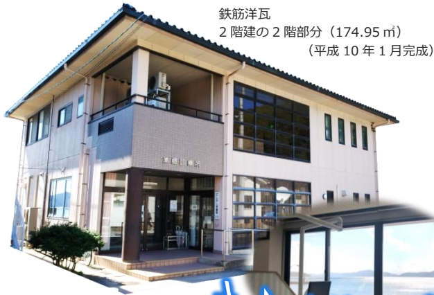
鉄筋洋瓦 2階建の2階部分 (174.95㎡) (平成10年1月完成)