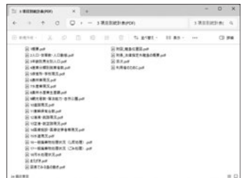
画面8 「項目別統計表(PDF)フォルダー」

項目別ファイルは複数のページで構成されています。ページの切り替え、印刷等はAdobe Acrobat Readerの操作方法に従ってください。