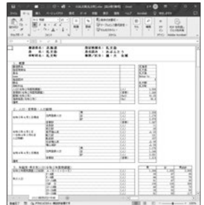
画面7 「島別統計ファイル」