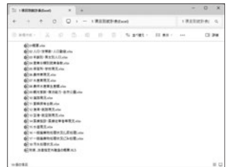
画面2 「項目別統計表 (Excel) フォルダー」

項目別統計表は、基本的に「利用上の注意」「都道府県」「詳細」「詳細(集計行非表示)」の4つのシートで構成されています。