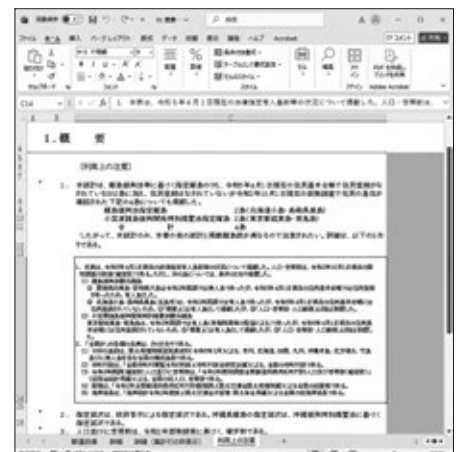
画面3 「シート見出し」

なお、ファイルは読み取り専用になっているため上書き保存できません。画面4のメッセージが表示された場合は「OK」をクリックしてください。