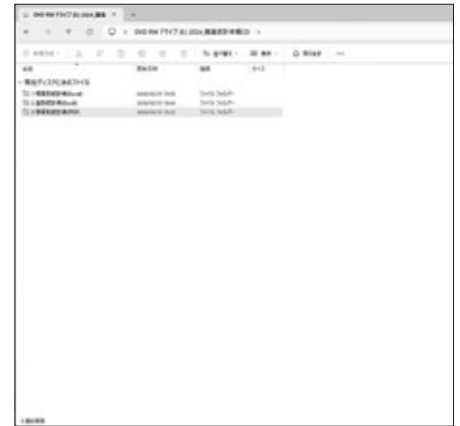
画面1 「CD-ROM収録フォルダー」

このCD-ROMをドライブに挿入してエクスプローラーでフォルダーを開いてください。各種統計のファイルが収録されたフォルダー（画面1）が表示されます。