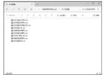
画面6 「都道府県別フォルダー」