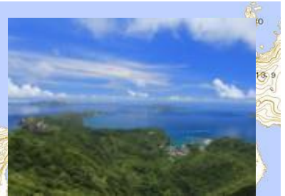
(山頂付近からの眺望)