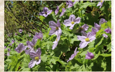
(ドンデンのシラネアオイ)