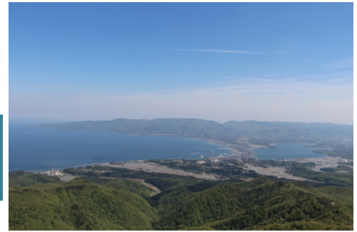
(ドンデンから両津湾・加茂湖を望む)